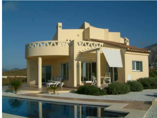
Top of the Hill

A very well appointed southwest facing villa, right above Mijas Golf with magnificent views to the sea and the mountains, just 5 min. to the famous ★★★★★ Hotel Byblos Andaluz, one of the „Leading Hotels of the world“ and the Clubhouse.